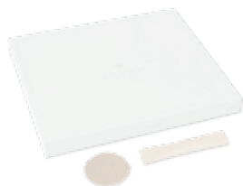
ここひなた 31袋(1袋1.05g/1ヵ月分) 定期購入のメリット 6,138円(税込) | 2204 |

それは「ここひなた」というもので、さっそく試してみると、薬草っぽい苦味で正直、すごくマズい。でも風呂の30分くらい前に飲んでみると10分くらいでおなかポカポカ。そ